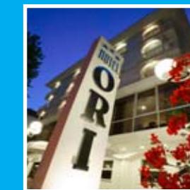
HOTEL ORI Cesenatico ★★★ sup